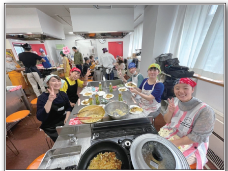
グループワークの一環でお好み焼き作りをする様子

A ともだち活動はもちろんですが、グループワークと自己研鑽に注力しています。ここ数年のグループワークでは、バーベキュー、横浜の街散策、ビーチボールバレー、お好み焼き作りを実施しました。グループワークに少年が参加してくれたことがきっかけで、ともだち活動が始まったケースもあり、継続的に少年と関わる機会を作り続けることが重要だと考えています。ともだち活動は、年間数名の少年を途切れることなく担当しており、毎月開催している定例会の中で進捗を報告し、会員や保護司の方から様々な角度でアドバイスをもらい、定例会が研鑽活動の場にもなっています。また、新たな活動として、神奈川県内の児童家庭支援センターへの訪問活動を開始し、地域に根ざした活動も行っています。