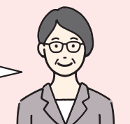
更生保護女性会員

たとえば、地域の人たちに更生保護の心を伝えるミニ集会や、子育てに悩むお母さんたちを集めての子育て支援教室、地域の子どもたちと一緒に非行防止活動といった活動もありますよ。