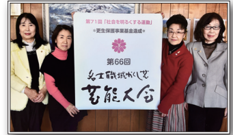
名士職域かくし芸芸能大会にて

A 毎年、“社会を明るくする運動”の一環として、当会主催で「名士職域かくし芸芸能大会」を実施しています。当日は、子供たちのミュージカルや日本太鼓演奏等の出し物で大いに賑わいます。保護観察所、保護司会、BBS会を始め、市内の多くの団体の御協力の下、開催することができ、人と人とが繋がることの大切さを再認識することができる活動です。