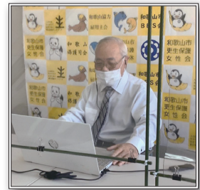
幸福の黄色いバックパネル

また、パソコンを操作することができる保護司に教わりながら、オンライン会議を行うようになりました。最初は分からないことだらけでしたが、最近は少しずつ慣れてきました。やればできるものです。画面越しの相手にわかりやすいよう、保護司会・更生保護女性会・BBS 会の名前が入った“幸福の黄色いバックパネル”を作成したり、みんなで知恵を出し合いながら頑張っています。